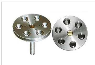
EM-Tec TG6 TEM グリッドホルダー、6 個までの TEM グリッド \varnothing 25 \times 3.2\text{mm} 、アルミ製、ピンスタブ